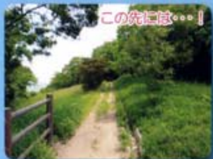
この先には・・・！