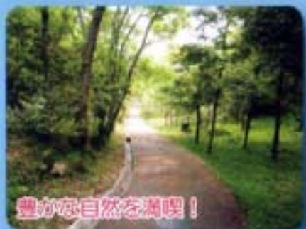
豊かな自然を満喫！